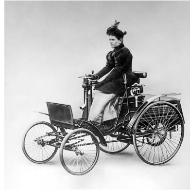
Mannheim & Benz?

Berta Benz brachte von Mannheim aus den Erfolg der Automobile ins Rollen.