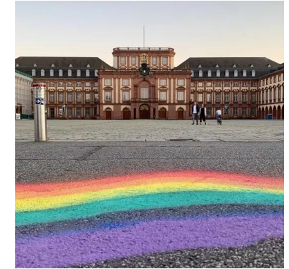
LGBTIQ+ Freedom Zone

In Mannheim und nicht in Italien wurde das Spaghetti Eis erfunden. Lust auf das Original von Eis Fontanelle in Q7 oder O4, 5