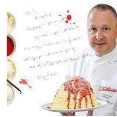
Spaghetti Eis made in Mannheim

Der Mannheimer Luisenpark beherbergt nicht nur die BUGA, sondern auch das größte chinesische Teehaus außerhalb Chinas – Ein Besuch wert und unweit unserer Abendlocation dem Bootshaus am Fernsehturm.