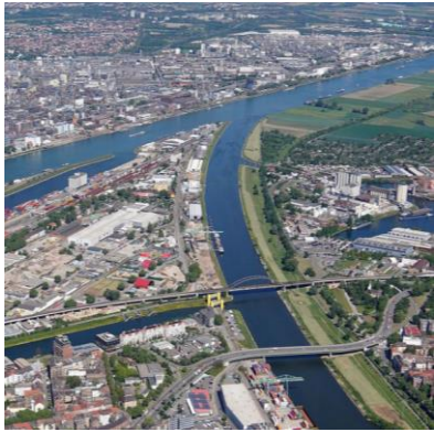
Rhein – Mannheim – Neckar

Es gibt nicht viele Städte eingerahmt von 2 Flüssen. Da kann nur noch Koblenz mit Rhein & Mosel mithalten.